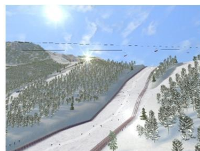
ローザ・コテル・アルパイン・センター （アルペンスキー会場）