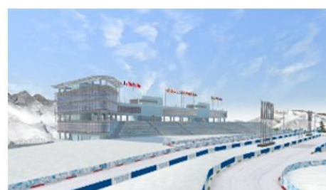
ローラ・クロスカントリースキー・アンド・ バイアスロン・コンプレックス （バイアスロン・クロスカントリースキー会場）