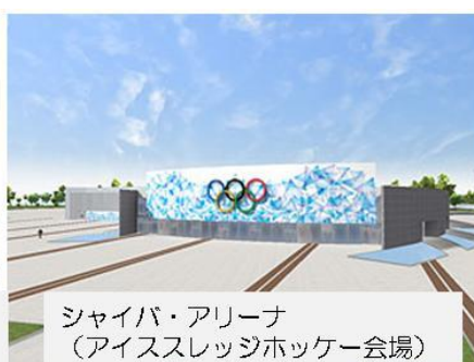
シャイバ・アリーナ （アイススレッジホッケー会場）