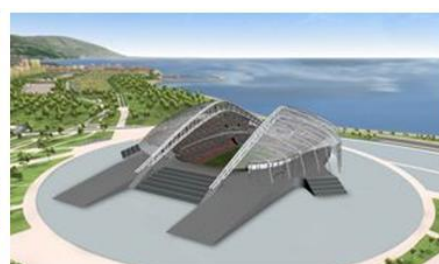
オリンピック・スタジアム (開閉会式・メダルセレモニー会場)