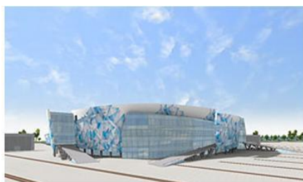
アイスクューブ・カーリング・センター (車いすカーリング会場)